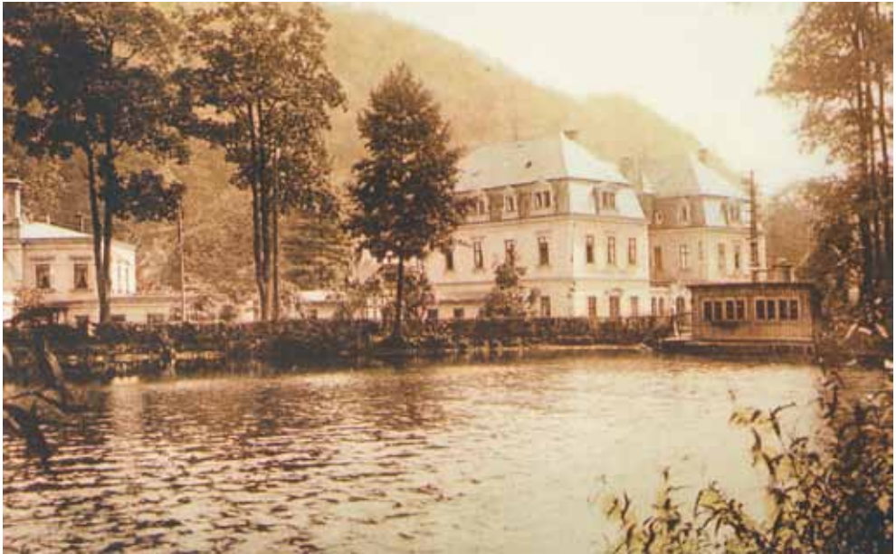
Auf dem Gelände des alten, Bauschäden aufweisenden Stadtbadhotels sind moderne Gebäude der Fakultät Forst-, Geo und Hydrowissenschaften, Fachrichtung Forstwissenschaften der Technischen Universität Dresden errichtet worden: Judeich-Bau, forstliche Bibliothek und Mensa.