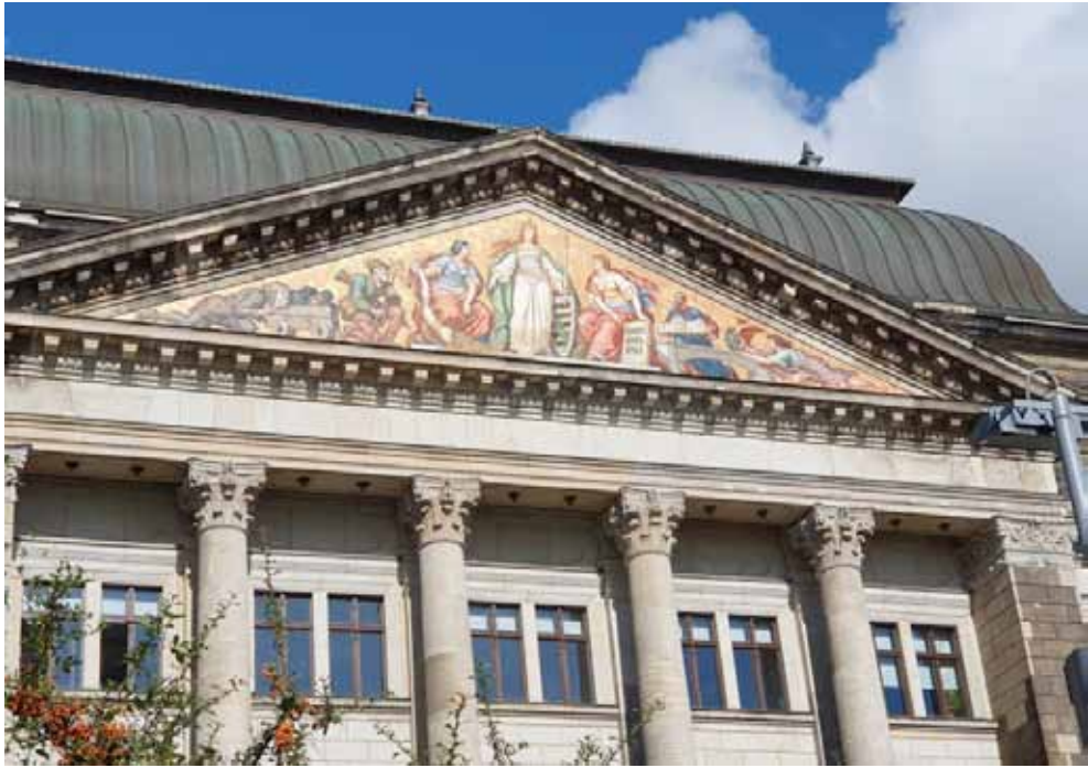
Giebelbild des Sächsischen Staatsministeriums für Finanzen