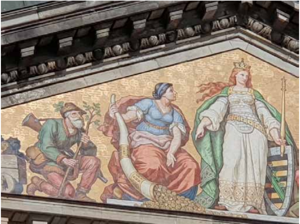
Ausschnitt aus dem Giebelbild am Sächsischen Staatsministerium der Finanzen