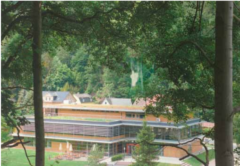
Neubau (jetzt Roßmäßler-Bau): Zweigbibliothek der SLUB und Mensa, eingeweiht im Jahr 2005, war davor Standort des Stadtbad-Hotels.