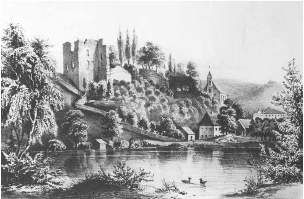
Schlossteich und Burgberg in einer historischen Darstellung

1870 unter besonderer Direction eine landwirthschaftliche Abtheilung verbunden gewesen ist; zu ihr gehört der vorzüglich gepflegte und als Zierde der Stadt von Einheimischen und Fremden vielbesuchte forstbotanische Garten, desgleichen eine nach Tausenden von Bänden zählende Bibliothek, eine nach Umfang und Einrichtung gleichbedeutende, beziehentlich ihres reichen Schatzes systematisch geordneter Thierschädel einzig dastehende naturwissenschaftliche Sammlung, sowie ein allen Erfordernissen der Jetztzeit genügendes, in eigenem Hause neu eingerichtetes chemisches Laboratorium; außerdem befindet sich noch im Akademiegebäude unter Leitung des Professors der Botanik ein Gleichfalls rühmlichst bekanntes pflanzenphysiologisches Institut, sowie landwirthschaftliche Versuchs- und Samencontrol-Station.