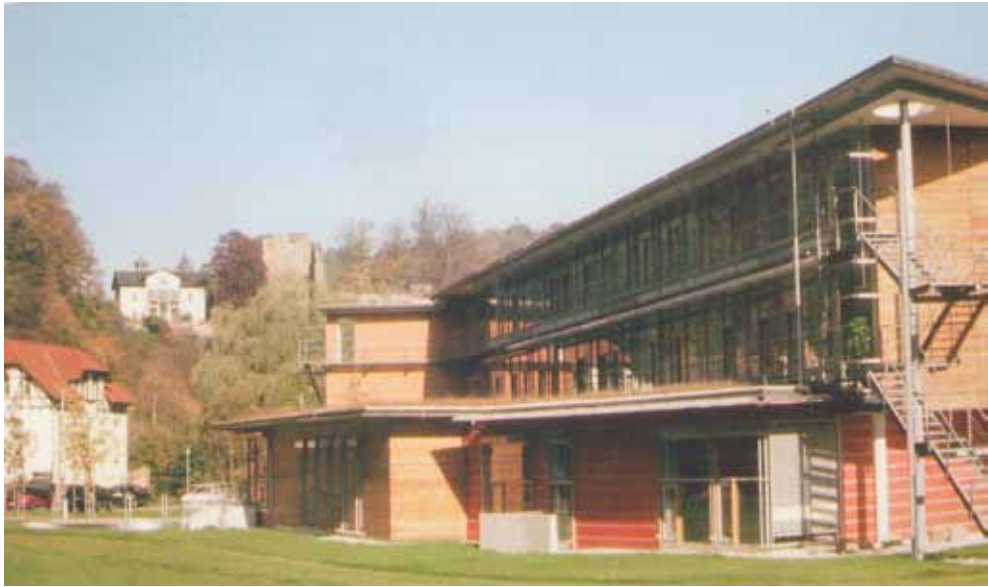
Im Vordergrund der neue Judeich-Bau (im Jahre 2000 eingeweiht), im Hintergrund auf dem Berg (links) die Villa von Prof. J. A. Stöckhardt, daneben (rechts) die Burgruine.