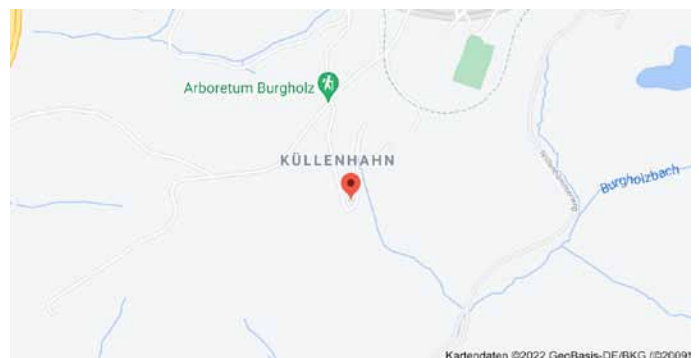
Karte mit Anfahrtsskizze

Das funktioniert mit den Bäumen im Wald natürlich genauso, z.B. für die „Dicke Buche“ in Krombach (s. folgende Seite).