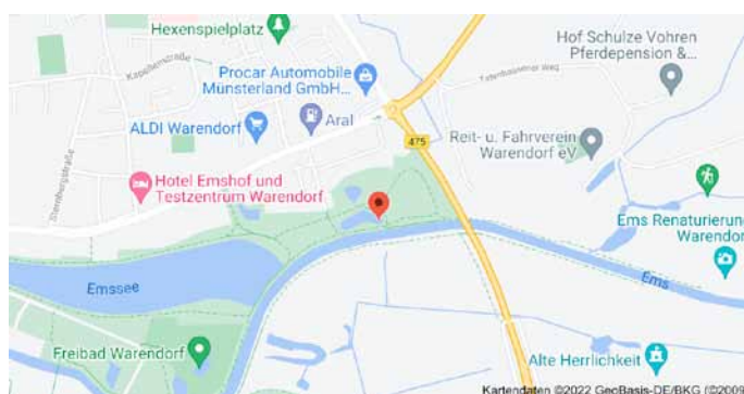
Karte mit Anfahrtsskizze

werden kann. Der Ort, an dem der gesuchte Baum steht, wird mit einem Punkt in einer Karte markiert: