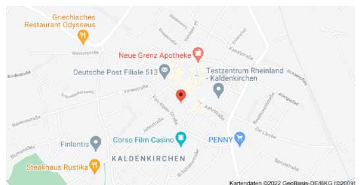
Karte mit Anfahrtsskizze

Vermutlich der stärkste Bergmammutbaum in NRW mit einem Stammumfang von mehr als 8 m. Nicht weit davon entfernt ist eine berühmte Sammlung von Baumarten: „Sequoiafarm Kaldenkirchen“ mit vielen dendrologischen Kostbarkeiten.