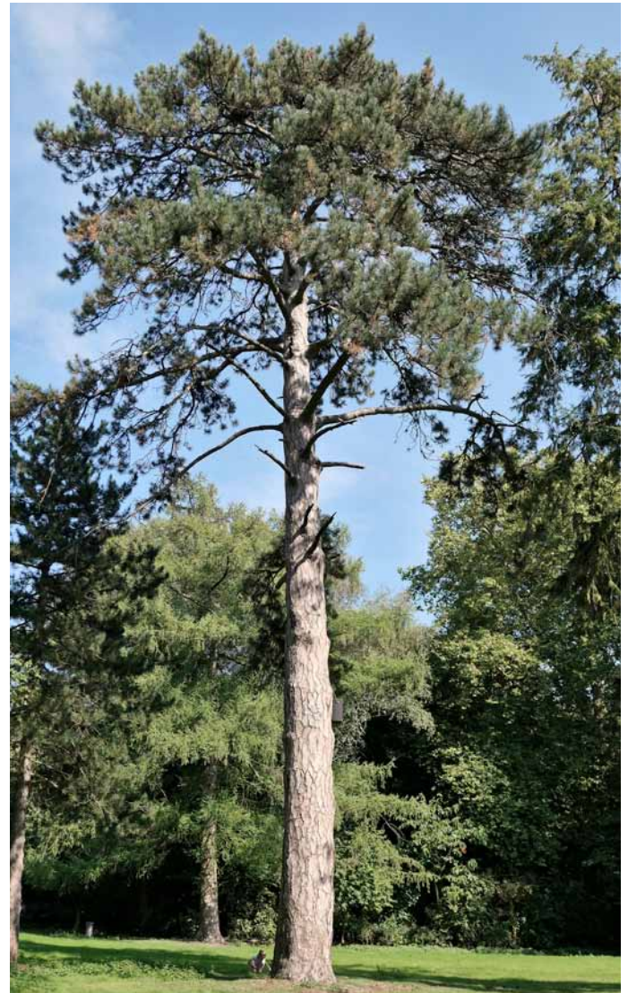
Die Schwarz-Kiefer mit einer Höhe von 24 m

Der QR-Code kann mit einem Mobiltelefon in Sekunden eingelesen werden, vorausgesetzt, eine kostenlose App ist hierfür installiert. Nach dem Einlesen erscheinen zunächst die Koordinaten, zu der bei Google eine Landkarte gesucht werden kann. Der Ort, an dem der gesuchte Baum steht, wird mit einem Punkt in einer Karte markiert: