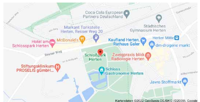
Karte mit Anfahrtsskizze

Das funktioniert mit den Bäumen im Wald natürlich genauso, z.B. für die „Dicke Buche“ in Krombach (s. folgende Seite).