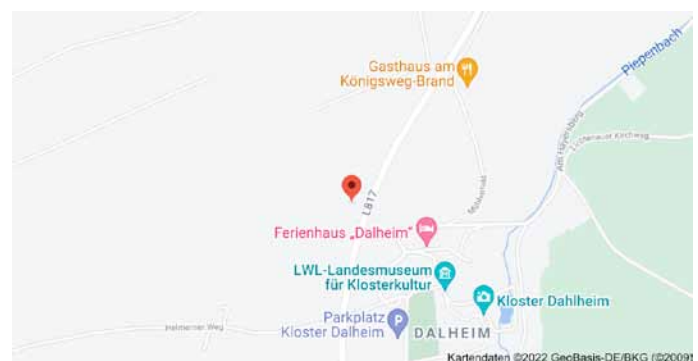
Karte mit Anfahrtsskizze

Der QR-Code kann mit einem Mobiltelefon in Sekunden eingelesen werden, vorausgesetzt, eine kostenlose App ist hierfür installiert. Nach dem Einlesen erscheinen zunächst die Koordinaten, zu der bei Google eine Landkarte gesucht werden kann. Der Ort, an dem der gesuchte Baum steht, wird mit einem Punkt in einer Karte markiert: