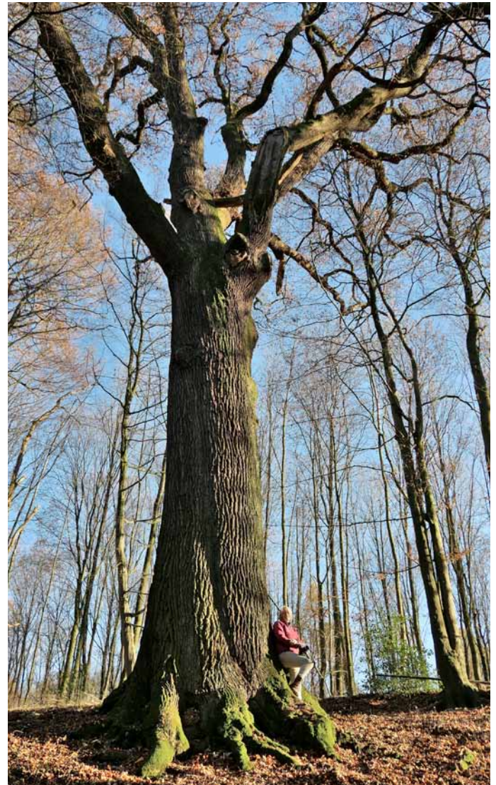
Die Dicke Eiche beim ehemaligen Rittergut Alt-Bernsau, ein gewaltiger Baum mit einem Umfang von 6,4 m

Der QR-Code kann mit einem Mobiltelefon in Sekunden eingelesen werden, vorausgesetzt, eine kostenlose App ist hierfür installiert. Nach dem Einlesen erscheinen zunächst die Koordinaten, zu der bei Google eine Landkarte gesucht werden kann. Der Ort, an dem der gesuchte Baum steht, wird mit einem Punkt in einer Karte markiert: