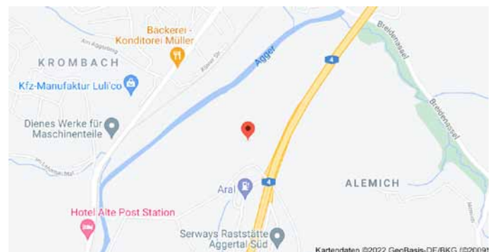
Karte mit Anfahrtsskizze

Das funktioniert mit den Bäumen im Wald natürlich genauso, z.B. für die „Dicke Buche“ in Krombach (s. folgende Seite).