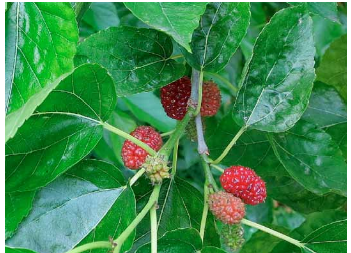
Früchte des Maulbeerbaums (Buch, S. 278)

Abschließend noch ein interessanter Hintergrund zu den Maulbeerbäumen von Krefeld, bei denen die Geschichte der Seidenraupenzucht in Europa erzählt wird: Seidenraupen ernähren sich ausschließlich vom Laub des Maulbeerbaums, in China war dies seit mehr als 4500 Jahren bekannt. Das Wissen um die Aufzucht der Raupen wurde von den Chinesen gehütet, aber wie auch beim Tee war es nicht zu verhindern, dass es über Byzanz nach Südeuropa gewandert ist, an den Comer See, wo bis heute prächtige und berühmte Villen vom Reichtum der Seidenhändler zeugen (die Villa Erba und die Villa d'Este sind legendär und bekannt aus Filmen mit George Clooney. Die Villa del Balbianello war Drehort für Star Wars und einen James Bond).