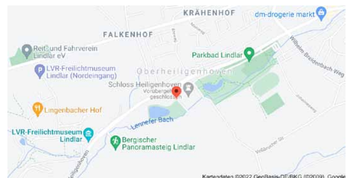
Karte mit Anfahrtsskizze

die Koordinaten, zu der bei Google eine Landkarte gesucht werden kann. Der Ort, an dem der gesuchte Baum steht, wird mit einem Punkt in einer Karte markiert: