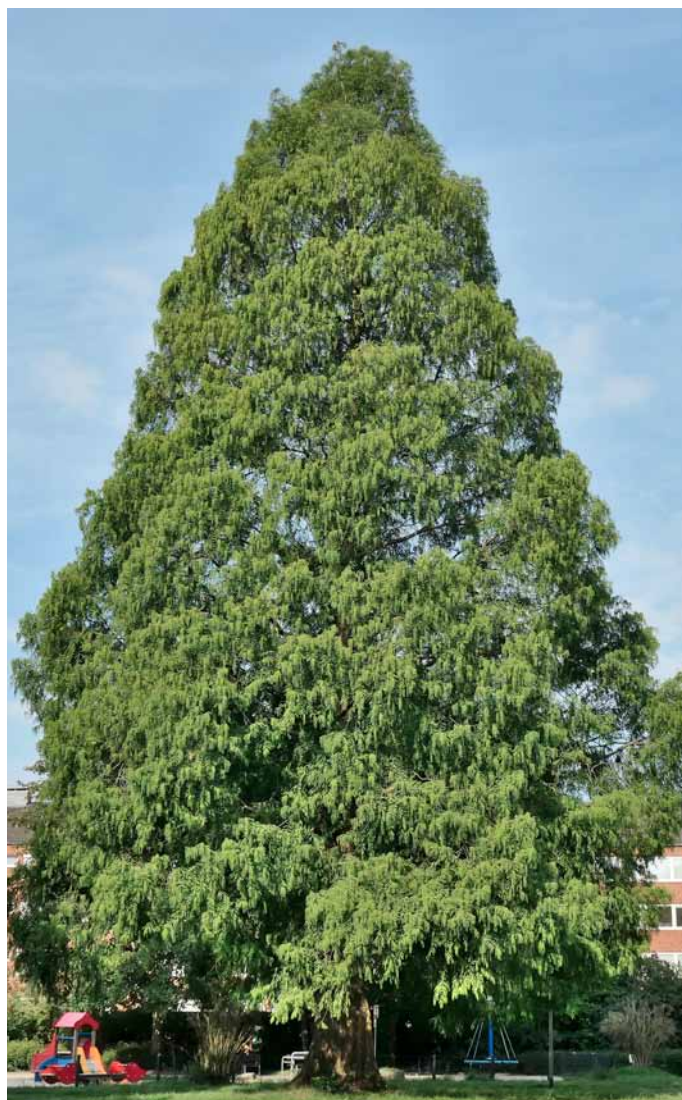
Urweltmammutbaum in Münster (Buch S. 277) Höhe: 27 m, Kronenbreite: 13m

Der QR-Code kann mit einem QR-Scanner als kostenlos verfügbare App auf dem Mobiltelefon in Sekunden eingelezen werden. Mit dem Einlesen erscheinen Koordinaten, die mit einem Klick bei Google gesucht werden können. Der