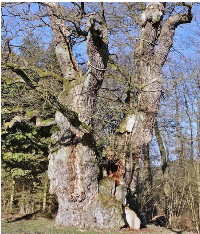
Der dickste Baum

2. Der höchste Baum ist eine Große Küstentanne bei Preußisch Oldendorf mit einer Höhe von 57 m (das ist etwa die Breite eines Fußballplatzes), im Buch auf S. 330.