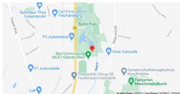
Karte mit Anfahrtsskizze

Der QR-Code kann mit einem Mobiltelefon in Sekunden eingelesen werden, vorausgesetzt, eine kostenlose App ist hierfür installiert. Nach dem Einlesen erscheinen zunächst die Koordinaten, zu der bei Google eine Landkarte gesucht werden kann. Der Ort, an dem der gesuchte Baum steht, wird mit einem Punkt in einer Karte markiert: