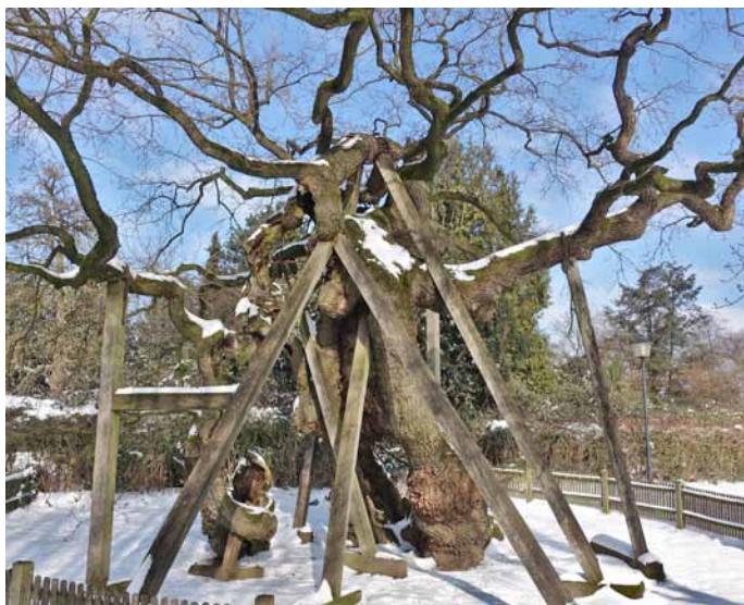
Der älteste Baum

3. Der älteste Baum ist vermutlich die Stiel-Eiche in dem Ort Erle, sein Alter wird auf 800-1000 Jahre geschätzt (S. 109 im Buch).