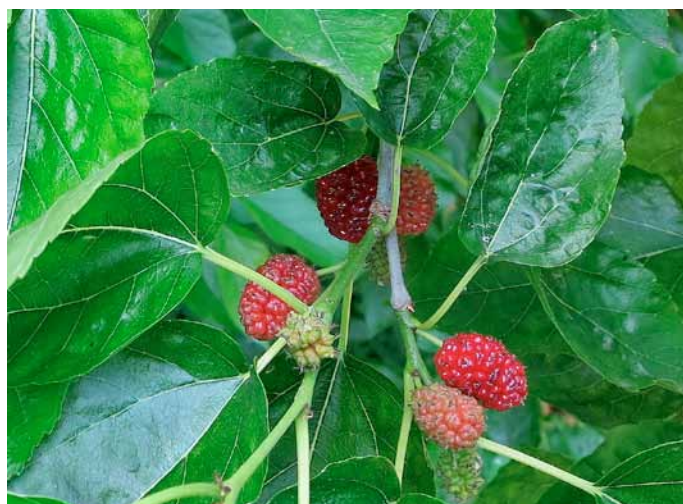
Früchte des Maulbeerbaums (Buch, S. 278)

Abschließend noch ein interessanter Hintergrund zu den Maulbeerbäumen von Krefeld, bei denen die Geschichte der Seidenraupenzucht in Europa erzählt wird: Seidenraupen ernähren sich ausschließlich vom Laub des Maulbeerbaums, in China war dies seit mehr als 4500 Jahren bekannt. Das Wissen um die Aufzucht der Raupen wurde von den Chinesen gehütet, aber wie auch beim Tee war es nicht zu verhindern, dass es über Byzanz nach Südeuropa gewandert ist, an den Comer See, wo bis heute prächtige und berühmte Villen vom Reichtum der Seidenhändler zeugen (die Villa Erba und die Villa d'Este sind legendär und bekannt aus Filmen mit George Clooney. Die Villa del Balbianello war Drehort für Star Wars und einen James Bond).