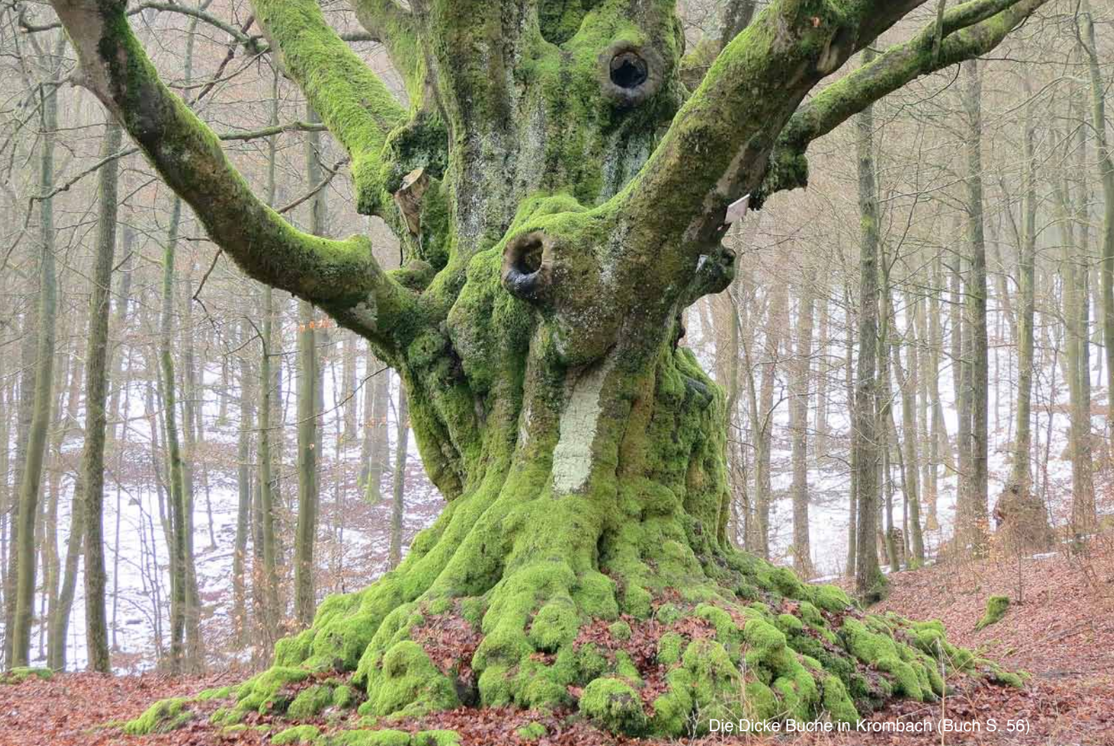
Die Dicke Buche in Krombach (Buch S. 56)