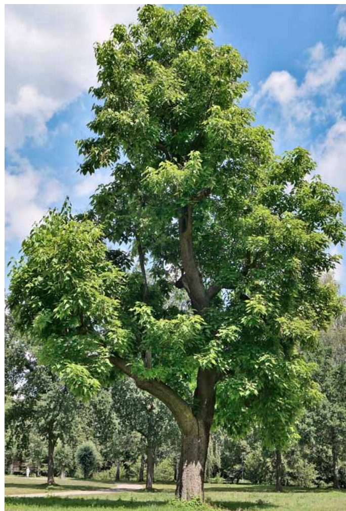
Prächtiger Trompetenbaum im Beller Park

Der QR-Code kann mit einem Mobiltelefon in Sekunden eingelesen werden, vorausgesetzt, eine kostenlose App ist hierfür installiert. Nach dem Einlesen erscheinen zunächst die Koordinaten, zu der bei Google eine Landkarte gesucht werden kann. Der Ort, an dem der gesuchte Baum steht, wird mit einem Punkt in einer Karte markiert: