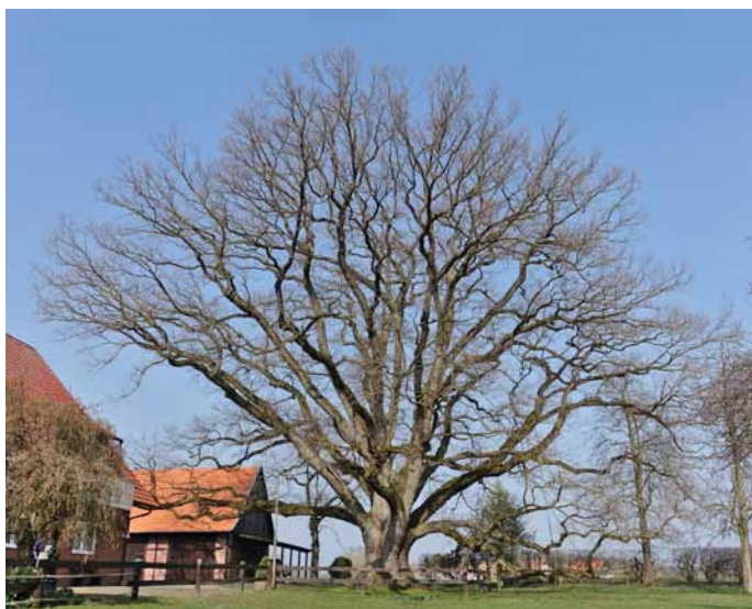
Der Baum mit der größten Krone

4. Der Baum mit der breitesten Krone ist die Stiel-Eiche auf dem Hof Fahrenbrink mit einer Kronenbreite von 38 m (S. 117 im Buch).