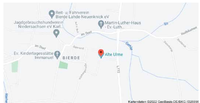
Karte mit Anfahrtsskizze

Der QR-Code kann mit einem Mobiltelefon (mit kostenloser App) in Sekunden eingelesen werden. Nach dem Einlesen erscheinen zunächst die Koordinaten, zu der bei Google eine Landkarte gesucht wird. Der Ort, an dem dieser Baum steht, wird mit einem Punkt in einer Karte markiert: