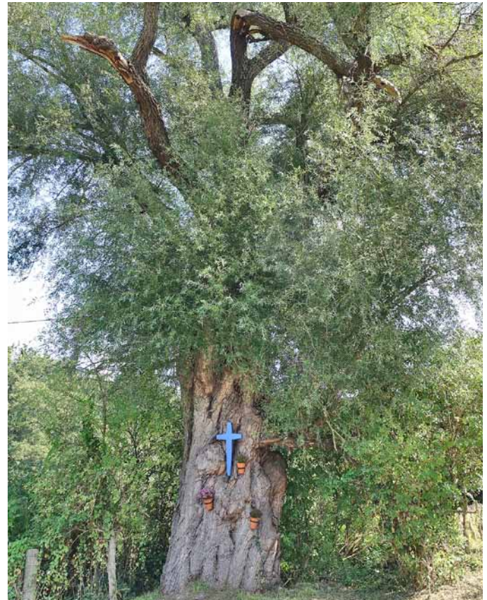
Die Silber-Weide bei Erkrath, im Naturschutzgebiet Düsselau vor dem Haus Gödinghoven am Mauspfad, eine sehr alte Fernstraße aus vorrömischer Zeit.

Der QR-Code kann mit einem Mobiltelefon (mit kostenloser App) in Sekunden eingelesen werden. Nach dem Einlesen erscheinen zunächst die Koordinaten, zu der bei Google eine Landkarte gesucht wird. Der Ort, an dem dieser Baum steht, wird mit einem Punkt in einer Karte markiert: