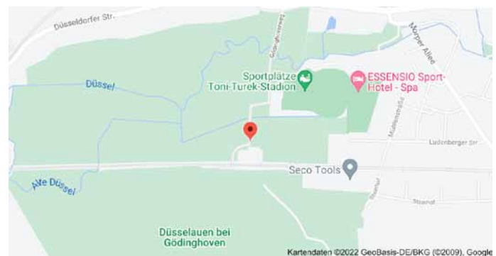
Karte mit Anfahrtsskizze

Das funktioniert mit den Bäumen im Wald natürlich genauso, z.B. für die „Dicke Buche“ in Krombach (s. folgende Seite).