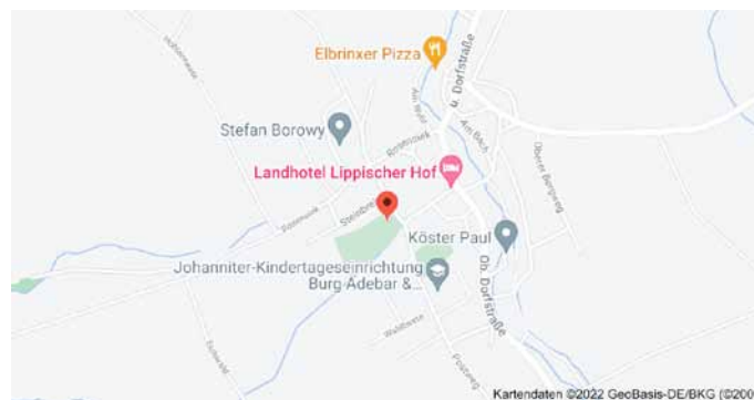
Karte mit Anfahrtsskizze

Der QR-Code kann mit einem Mobiltelefon (mit kostenloser App) in Sekunden eingelesen werden. Nach dem Einlesen erscheinen zunächst die Koordinaten, zu der bei Google eine Landkarte gesucht wird. Der Ort, an dem dieser Baum steht, wird mit einem Punkt in einer Karte markiert: