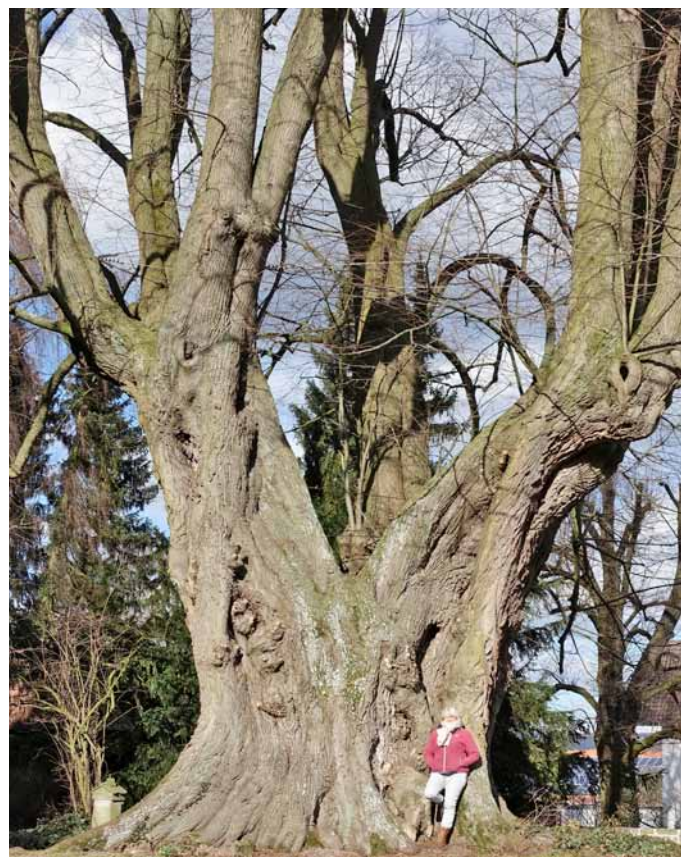
eine der ältesten und stärksten Linden Deutschlands: Die Wittekind-Linde in Elbrinxen

Zahlreiche doppelseitige Farbaufnahmen von eindrucksvollen Waldbildern, Solitärbäumen und Alleen, aber auch die bedrückende Situation einer kahlgeschlagenen Fichtenfläche nach dem Befall mit Borkenkäfern dokumentieren die Vielfalt der Naturerlebnisse des Landes.