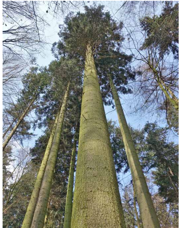
Der höchste Baum

2. Der höchste Baum ist eine Große Küstentanne bei Preußisch Oldendorf mit einer Höhe von 57 m (das ist etwa die Breite eines Fußballplatzes), im Buch auf S. 330.