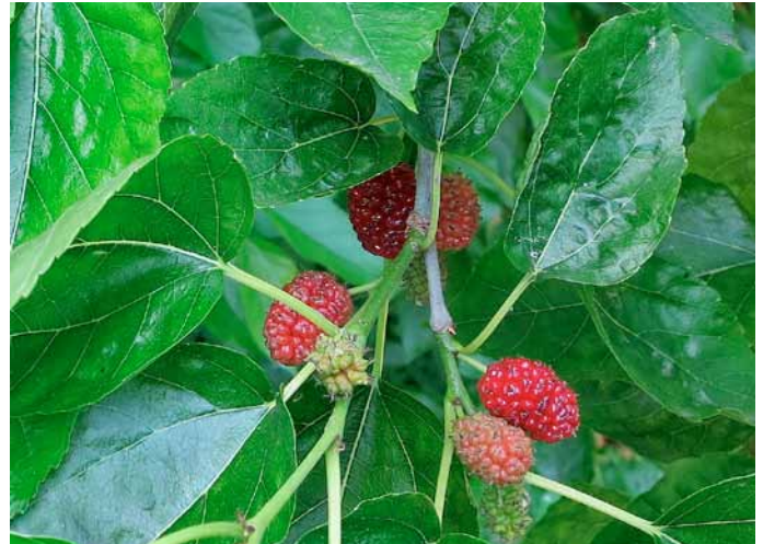
Früchte des Maulbeerbaums (Buch, S. 278)

Abschließend noch ein interessanter Hintergrund zu den Maulbeerbäumen von Krefeld, bei denen die Geschichte der Seidenraupenzucht in Europa erzählt wird: Seidenraupen ernähren sich ausschließlich vom Laub des Maulbeerbaums, in China war dies seit mehr als 4500 Jahren bekannt. Das Wissen um die Aufzucht der Raupen wurde von den Chinesen gehütet, aber wie auch beim Tee war es nicht zu verhindern, dass es über Byzanz nach Südeuropa gewandert ist, an den Comer See, wo bis heute prächtige und berühmte Villen vom Reichtum der Seidenhändler zeugen (die Villa d'Este ist legendär und bekannt aus Filmen mit George Clooney, die Villa del Balbianello war Drehort für Star Wars und einen James Bond).