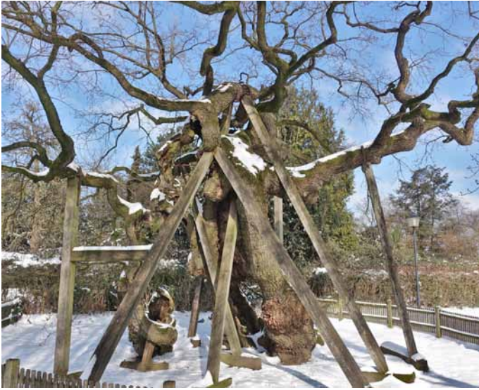
Der älteste Baum

3. Der älteste Baum ist vermutlich die Stiel-Eiche in dem Ort Erle, sein Alter wird auf 800-1000 Jahre geschätzt (S. 109 im Buch).