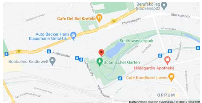
Karte mit Anfahrtsskizze

Der QR-Code kann mit einer QR-Scanner als kostenlos verfügbare App auf dem Mobiltelefon in Sekunden eingelesen werden. Mit dem Einlesen erscheinen Koordinaten, die mit einem Klick bei Google gesucht werden können. Diese markieren in der Google-Maps-Karte den Punkt, an dem der Baum steht.