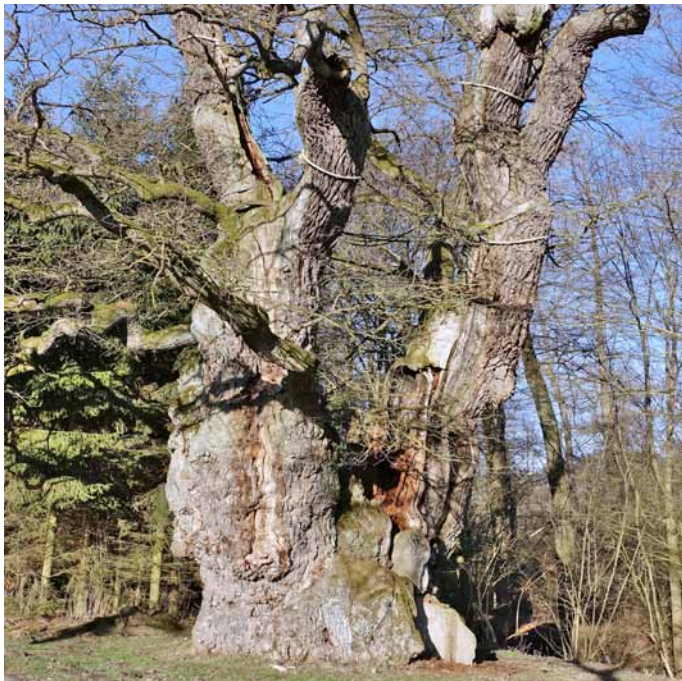
Der dickste Baum

1. Der dickste Baum ist eine Stiel-Eiche, die sogenannte „Rieseneiche“ bei Borlinghausen mit einem Stammumfang von unglaublichen 11 m (gemessen in 1,3 m Höhe), im Buch auf S. 124.