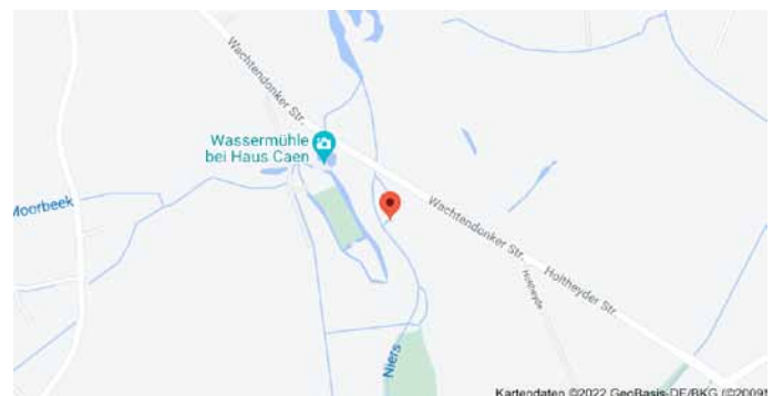
Karte mit Anfahrtsskizze

Der QR-Code kann mit einem QR-Scanner als kostenlos verfügbare App auf dem Mobiltelefon in Sekunden eingelesen werden. Mit dem Einlesen erscheinen Koordinaten, die mit einem Klick bei Google gesucht werden können. Der Ort, an dem dieser Baum steht, wird mit einem Punkt in einer Karte markiert: