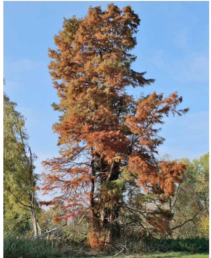
Zweizeilige Sumpfyzypresse bei Haus Caen

Zahlreiche doppelseitige Farbaufnahmen von eindrucksvollen Waldbildern, Solitärbäumen und Alleen, aber auch die bedrückende Situation einer kahlgeschlagenen Fichtenfläche nach dem Befall mit Borkenkäfern dokumentieren die Vielfalt der Naturerlebnisse des Landes.