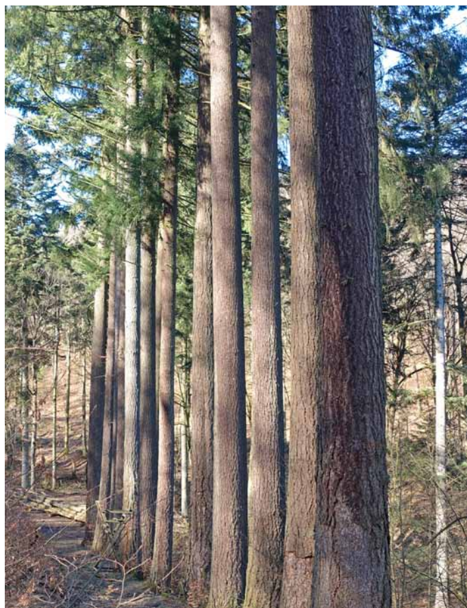
Die Himmelssäulen von Glindfeld (S. 68), die größten Lebewesen im Sauerland

Die QR-Codes vereinfachen im Gegensatz zu bisher verwen-