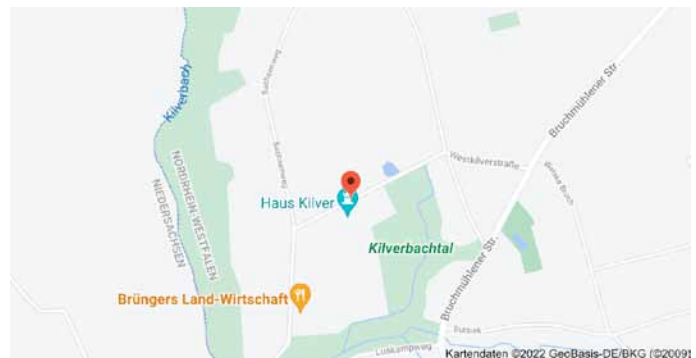
Karte mit Anfahrtsskizze

mit einem Klick bei Google gesucht werden können. Der Ort, an dem dieser Baum steht, wird mit einem Punkt in einer Karte markiert: