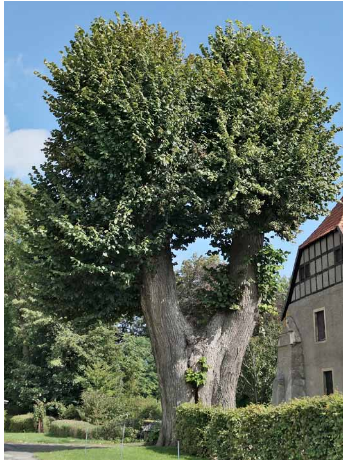
Sommer-Linde am Haus Kilver (S. 236), Stammumfang mehr als sechs Meter

Der QR-Code kann mit einem QR-Scanner als kostenlos verfügbare App auf dem Mobiltelefon in Sekunden eingelesen werden. Mit dem Einlesen erscheinen Koordinaten, die