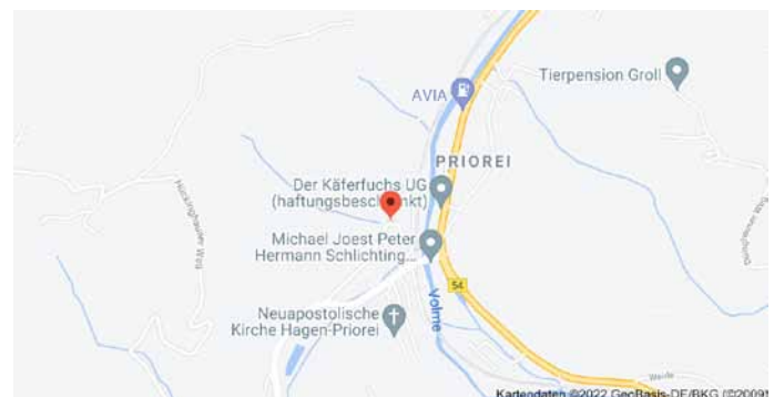
Karte mit Anfahrtsskizze

Ort, an dem dieser Baum steht, wird mit einem Punkt in einer Karte markiert: