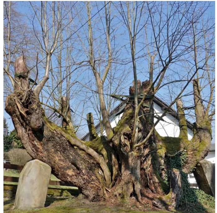
Die Priorlinden in Hagen-Priorei (Buch S. 216), man schätzt das Alter auf mehr als 700 Jahre

Umfang: 368 S., Format A4, ISBN: 978-3-945941-74-4, Preis: 36 Euro (alle Fotos stammen aus dem Buch)