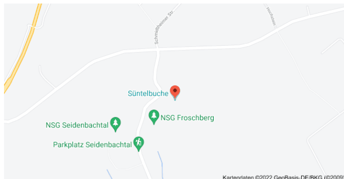
Karte mit Anfahrtsskizze

Der QR-Code kann mit einer QR-Scanner als kostenlos verfügbare App auf dem Mobiltelefon in Sekunden eingelesen werden. Mit dem Einlesen erscheinen Koordinaten, die mit einem Klick bei Google gesucht werden können. Der Ort, an dem dieser Baum steht, wird mit einem Punkt markiert: