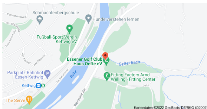
Karte mit Anfahrtsskizze

Der QR-Code kann mit einer QR-Scanner als kostenlos verfügbare App auf dem Mobiltelefon in Sekunden eingelesen werden. Mit dem Einlesen erscheinen Koordinaten, die mit einem Klick bei Google gesucht werden können. Der Ort, an dem dieser Baum steht, wird mit einem Punkt markiert: