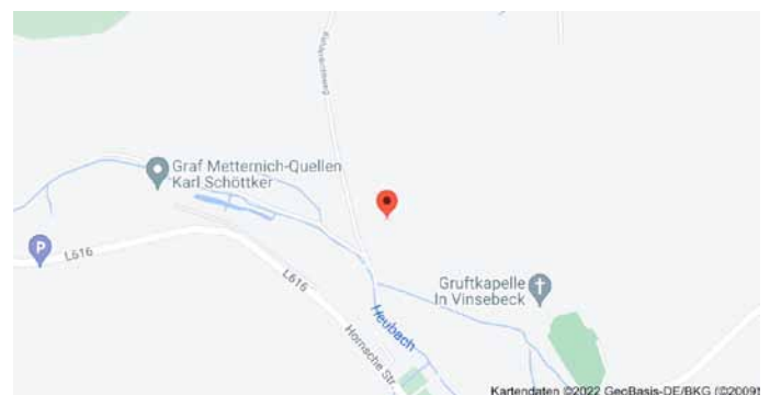
Karte mit Anfahrtsskizze

Der QR-Code kann mit einer QR-Scanner als kostenlos verfügbare App auf dem Mobiltelefon in Sekunden eingelesen werden. Mit dem Einlesen erscheinen Koordinaten, die mit einem Klick bei Google gesucht werden können. Der Ort, an dem dieser Baum steht, wird mit einem Punkt markiert: