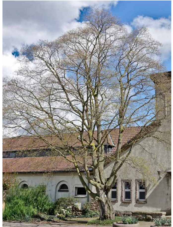
Kolchischer Ahorn vor dem Dortmunder Hauptfriedhof (Buch S. 32)

Die QR-Codes vereinfachen im Gegensatz zu bisher verwendeten Koordinatangaben das Auffinden der beschriebenen Bäume erheblich. Nachfolgend z.B. der QR-Code für den Kolchischen Ahorn in Dortmund: