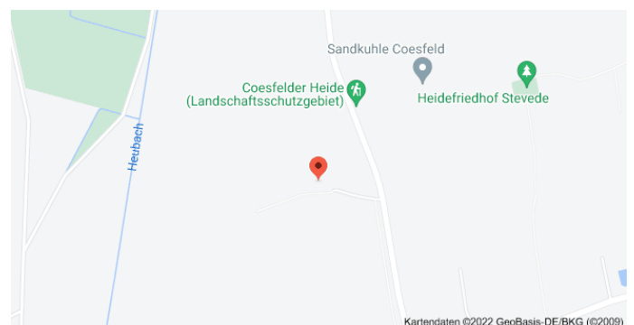
Karte mit Anfahrtsskizze

Das funktioniert mit den Bäumen im Wald natürlich genauso, z.B. für die „Dicke Buche“ in Krombach (s. folgende Seite).