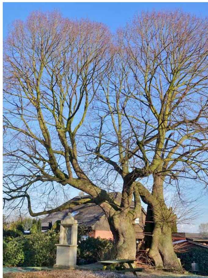
Dicke Linde in Asbeck (Buch S. 222)

Die QR-Codes vereinfachen im Gegensatz zu bisher verwendeten Koordinatangaben das Auffinden der beschriebenen Bäume erheblich. Nachfolgend z.B. der QR-Code für die dicke Linde in Asbeck: