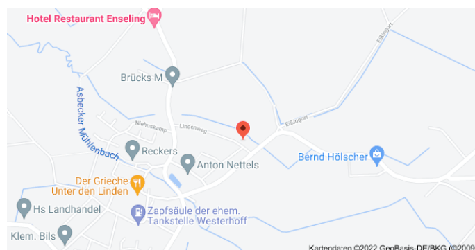
Karte mit Anfahrtsskizze

Der QR-Code kann mit einer QR-Scanner als kostenlos verfügbare App auf dem Mobiltelefon in Sekunden eingelesen werden. Mit dem Einlesen erscheinen Koordinaten, die mit einem Klick bei Google gesucht werden können. Der Ort, an dem dieser Baum steht, wird mit einem Punkt markiert: