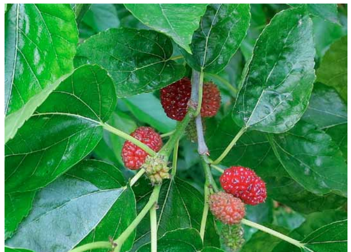
Früchte des Maulbeerbaums (Buch, S. 278)

Abschließend noch ein interessanter Hintergrund zu den Maulbeerbäumen von Krefeld, bei denen die Geschichte der Seidenraupenzucht in Europa erzählt wird: Seidenraupen ernähren sich ausschließlich vom Laub des Maulbeerbaums, in China war dies seit mehr als 4500 Jahren bekannt. Das Wissen um die Aufzucht der Raupen wurde von den Chinesen gehütet, aber wie auch beim Tee war es nicht zu verhindern, dass es über Byzanz nach Südeuropa gewandert ist, an den Comer See, wo bis heute prächtige und berühmte Villen vom Reichtum der Seidenhändler zeugen (die Villa d'Este ist legendär und bekannt aus Filmen mit George Clooney, die Villa del Balbaniello war Drehort für Star Wars und einen James Bond).