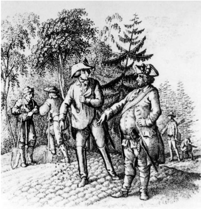
Abb. 3: Darstellung einer Eichelsaat (2. Hälfte des 18. Jh.). Bei dem Anweisung erteilenden Forstmann dürfte es sich zweifellos um den Oberforst- und Jägermeister Hans Dietrich von Zanthier handeln. Entnommen aus: Journal für das Forst- und Jagdwesen, Titelpuffer ab Band 1, Heft 1, 1790.

[...] da doch Beckmanns Schriften [...] die würdigsten zu damaligen Zeiten waren“ 20