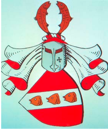
Abb. 2: Wappen der Familie von Zanthier. In: GHdA, Bd. 137, Adelslexikon (2005), C.A. Starke Verlag, Limburg a.d. Lahn.