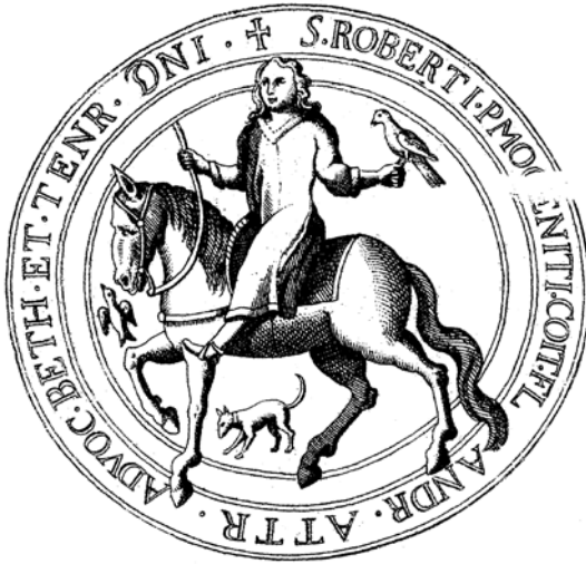
Abb. 1: (Jagd-)Siegel von 1265 des Robert III., Grafen von Flandern, genannt Robert von Béthune (1249-1322).

schrift lautet 9 : + S(IGILLUM) • ROBERTI • P(RI)MOGENITI • CO(M)IT(IS) • FLANDR(IAE) • ATTR(EBATENSIS) • AVOC • BETH(UNENSIS) • ET • TEN(DE)REMUNDENSIS • D(OMI)NI •